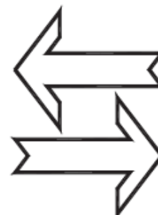
Możliwość wielokrotnego użycia opakowania