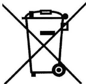
Symbol selektywnego zbierania