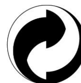
Udział w systemie odzysku i recyklingu odpadów opakowaniowych