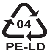
Opakowanie wykonane z polietylenu małej gęstości