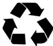
Opakowanie nadające się do recyklingu